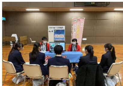
(管内学生への説明の様子)

X(旧Twitter)、Facebookを開設し、ホームページの周知や宗谷の医療について観光情報とともにPRを行った。