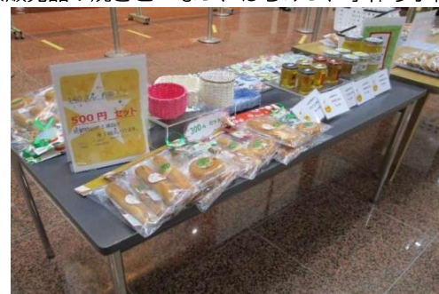
<販売品：焼きどーなつ、はちみつ、手作り小物>