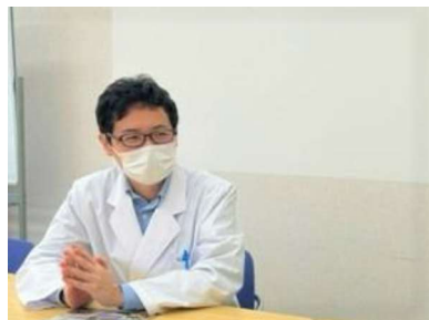
(利尻島国保中央病院の薬剤科長への取材)