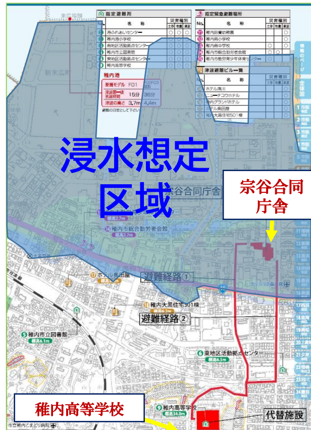
（稚内市津波ハザードマップ&避難経路） ※気象警報発表のため中止

地震発生後の大津波警報を想定した、代替施設である稚内高等学校への避難訓練については、気象警報発表のため中止。