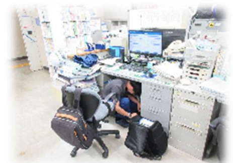
（シェイクアウト訓練）