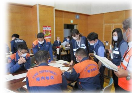
訓練想定に基づいた関係機関との連携