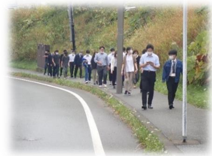
（R4: 稚内高等学校への避難） ※気象警報発表のため中止