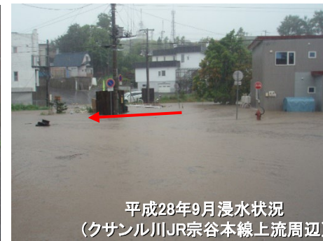
平成28年9月浸水状況 (クサナル川JR宗谷本線上流周辺)