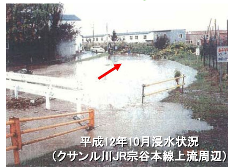
平成12年10月浸水状況 (クサナル川JR宗谷本線上流周辺)

■ 被害の軽減、早期復旧・復興のための対策 ・途絶することのない河川情報システム網の構築 ※今後、関係機関と連携して対策を検討する