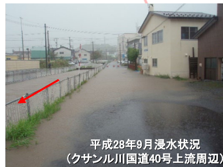
平成28年9月浸水状況 (クサナル川国道40号上流周辺)