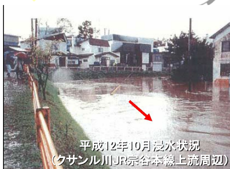
平成12年10月浸水状況 (クサナル川JR宗谷本線上流周辺)