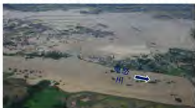
①鬼怒川の堤防決壊による浸水被害 (茨城県常総市)