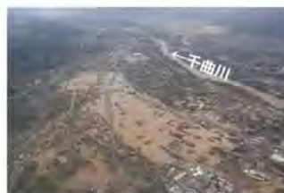
⑨千曲川における浸水被害状況 (長野県長野市)