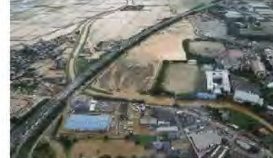
④桂川における浸水被害 (福岡県朝倉市)