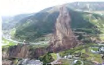
②土砂災害の状況 (熊本県南阿蘇村)