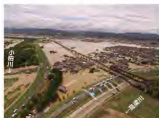
⑤小田川における浸水被害 (岡山県倉敷市)