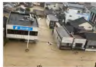
⑩球磨川における浸水被害状況 (熊本県人吉市)