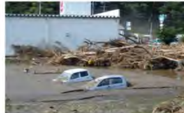
③小本川の氾濫による浸水被害 (岩手県岩泉町)