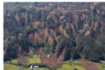
⑦土砂災害の状況 (北海道勇払郡厚真町)