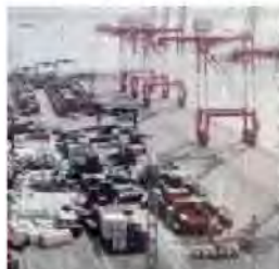
⑥神戸港六甲アイランドにおける浸水被害 (兵庫県神戸市)