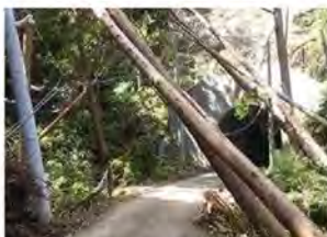
⑧電柱・倒木倒壊の状況 (千葉県鴨川市)