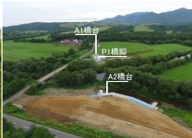
橋梁架替(一已内橋) (宗谷総合振興局)