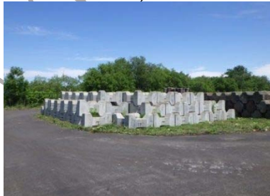
防災資材の備蓄施設の整備 (宗谷総合振興局)