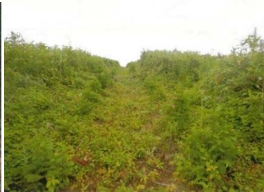
除間伐等の森林整備 (森林整備センター)