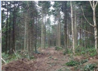
間伐の実施 (宗谷森林管理署)