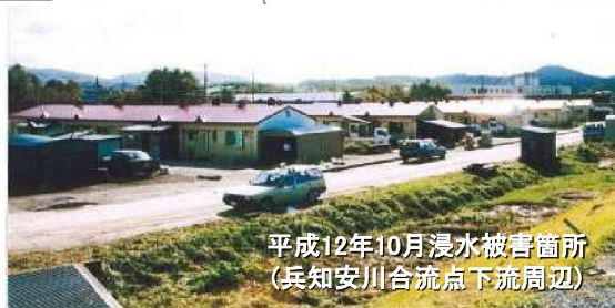
平成12年10月浸水被害箇所 (兵知安川合流点下流周辺)