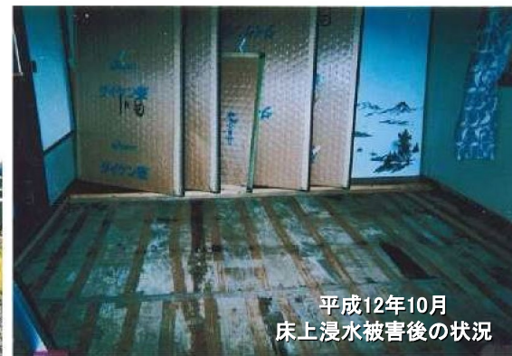
平成12年10月 床上浸水被害後の状況