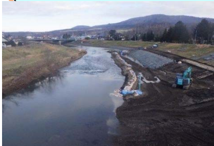
河道掘削(歌登橋から見送橋間) (宗谷総合振興局)