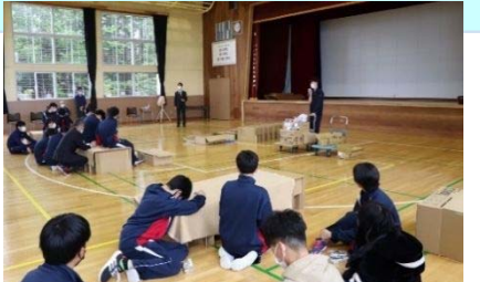
防災学校の実施 (枝幸町)