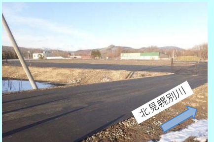
防災資材の備蓄施設の整備 (宗谷総合振興局)