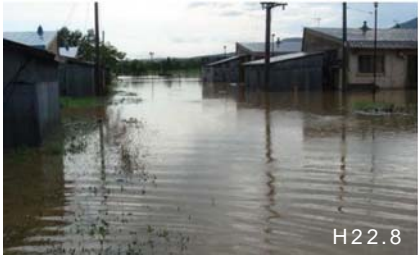
浸水状況(歌登地区) H22.8