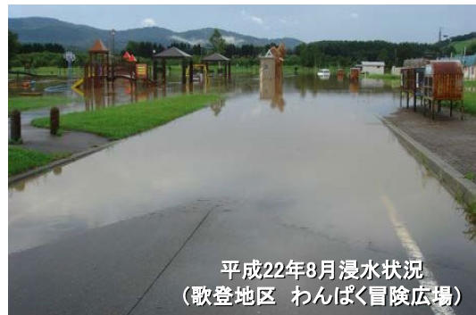
平成22年8月浸水状況 (歌登地区 わんぱく冒険広場)