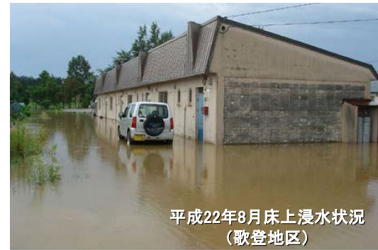
平成22年8月床上浸水状況 (歌登地区)