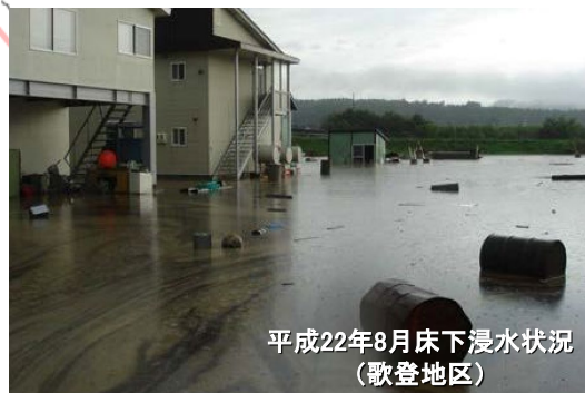
平成22年8月床下浸水状況 (歌登地区)