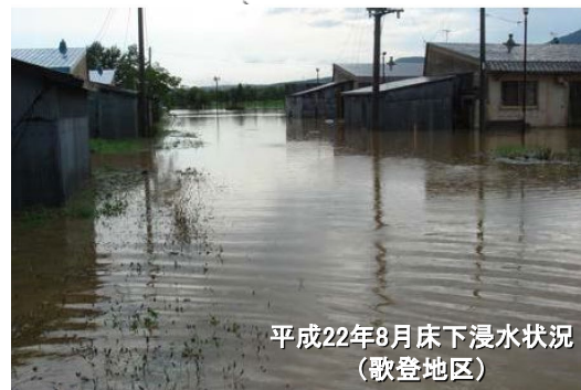
平成22年8月床下浸水状況 (歌登地区)