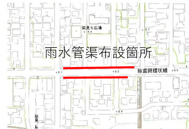
ウエンナイ川右岸排水区雨水管渠布設工事