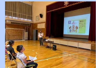
1日防災学校 (礼文町)