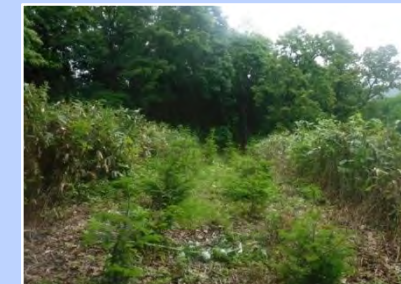
雑草や灌木を刈り払う作業実施 (宗谷森林管理署)