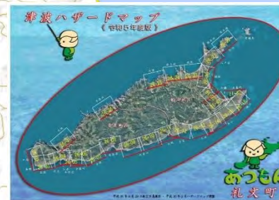
津波ハザードマップ (礼文町)