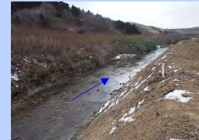
河道掘削 (宗谷総合振興局)