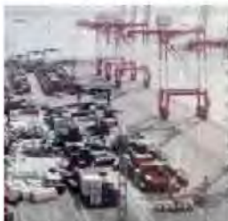
⑥神戸港六甲アイランドにおける浸水被害 (兵庫県神戸市)