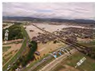
⑤小田川における浸水被害 (岡山県倉敷市)