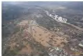
⑨千曲川における浸水被害状況 (長野県長野市)