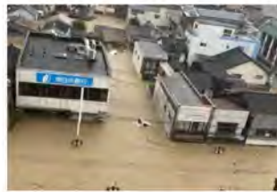
⑩球磨川における浸水被害状況 (熊本県人吉市)