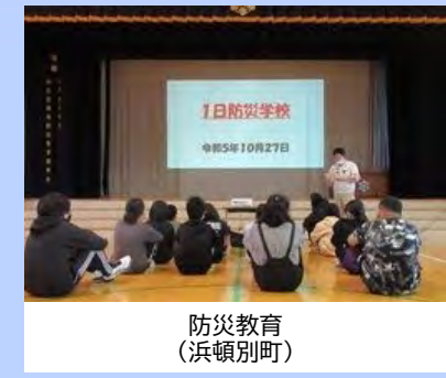
防災教育 (浜頓別町)

■ 被害の軽減、早期復旧・復興のための対策 ・情報配信、防災無線等を活用した情報発信の強化 ・洪水ハザードマップの周知・利用促進、防災教育、高潮浸水シミュレーション(想定最大規模)の実施・公表 ・水防災意識の啓発のための広報の充実 ・水位計、監視カメラによる情報提供 ・早期復旧に備えた防災資材備蓄の検討・整備