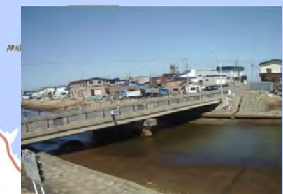
危機管理型水位計 (宗谷総合振興局)