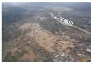
⑨千曲川における浸水被害状況 (長野県長野市)