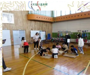
1日防災学校 (枝幸町)