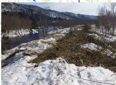
伐木 (宗谷総合振興局)