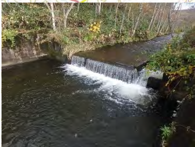
魚道工の整備 (宗谷総合振興局)