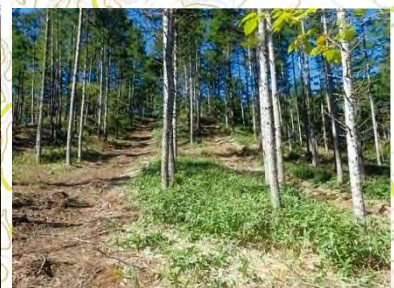
森林整備 (森林整備センター)