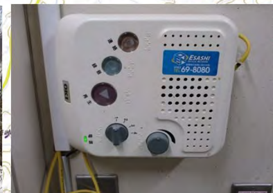
音声告知端末 (枝幸町)