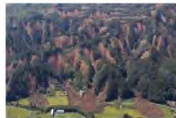
⑦土砂災害の状況 (北海道勇払郡厚真町)