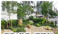
雨庭の整備（京都市）